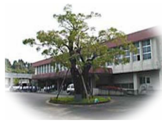
“あふち(せんだん)”の木

準備のため、出欠のご連絡を 5月10日(火)までにメールまたは同封のはがきで、事務局までお願い致します。