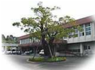
“あふち(せんだん)”の木

準備のため、出欠のご連絡を5月11日(月)までに メールまたは同封のがきで、事務局までお願い致します。