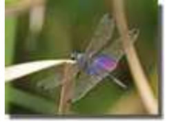
ハネナガチョウトンボ

このほか、「ハネナガチョウトンボ」の日本初の発見や野菜作りなどご紹介したい話はいっぱいあります。当日先生から直接伺いましょう!